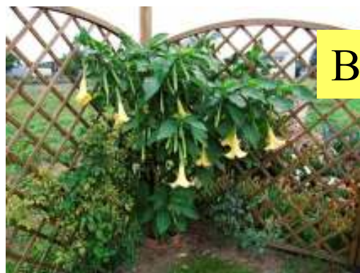
Bieluń - datura